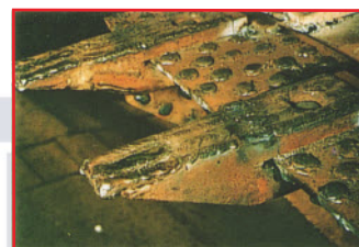
Uña de pala mecánica